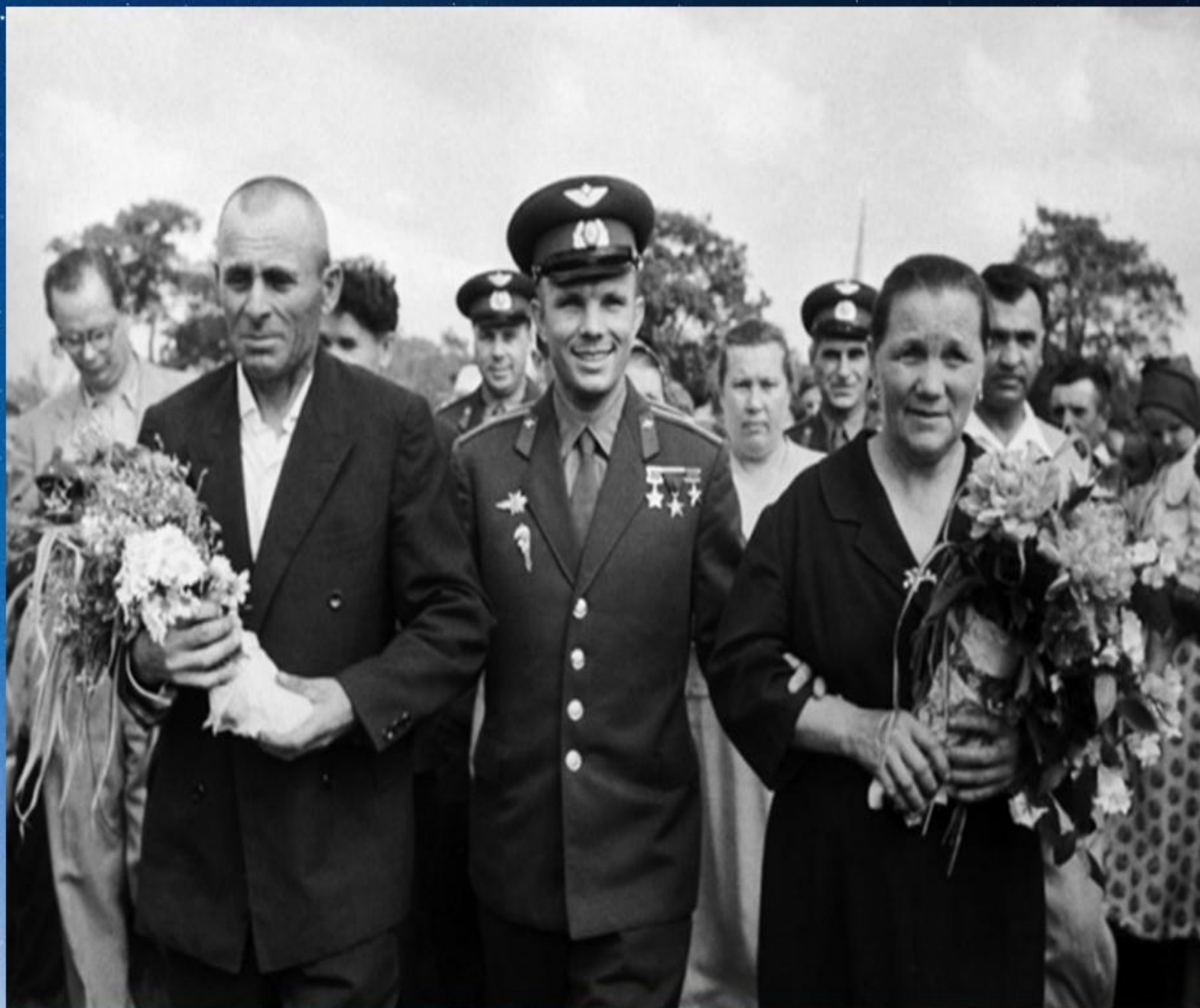
Юрий Гагарин с родителями