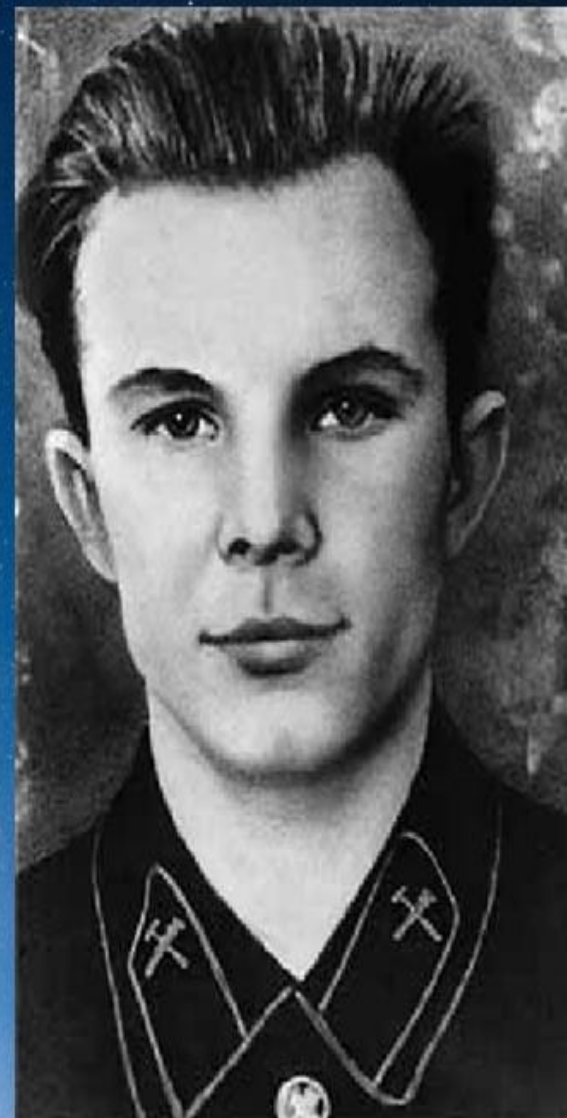
Саратовский индустриальный техникум